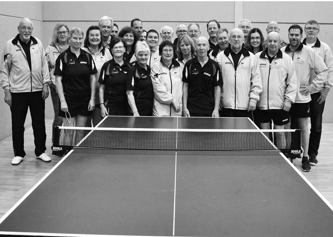
Alle Teilnehmer am Sonntag morgen vor den letzten Wettkämpfen

Achtet also in der letzten Ausgabe im nächsten Jahr auf die Ausschreibung zu den Internationalen Mannschaftsmeisterschaften der Seniorenvereinigungen.