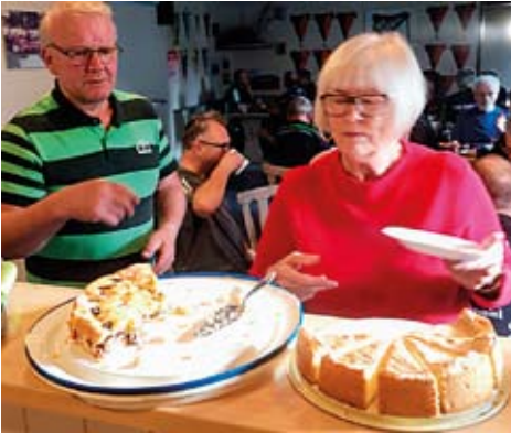
Gute Versorgung ist wichtig

jährliche Jahresabschlussfeier mit einem Doppeltturnier und anschließendem gemeinsamen Abendessen. Auch steht er bei allen Fragen zum Seniorennachmittag zur Verfügung. (Adressen und Berichte auf der Homepage des TTBEZAB.)