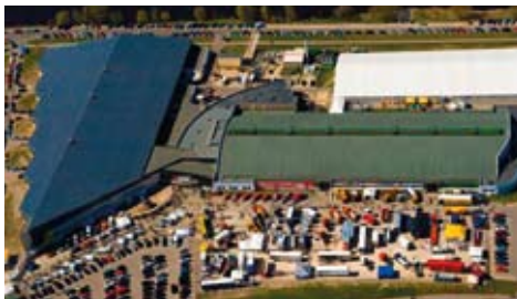
Internationales Messezentrum Kipsala

Die sportliche Anmeldung wird am 1. August 2026 geöffnet.